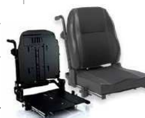
Rücken: AVA 2172 bzw. 2173