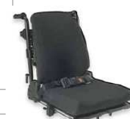
Rücken: AVA 2174, 2175